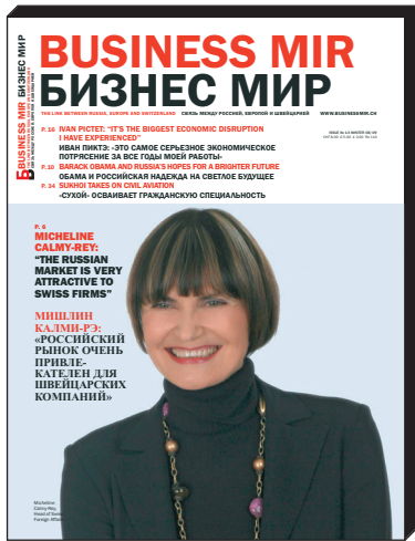
Business Mir n° 13 Winter 08/09