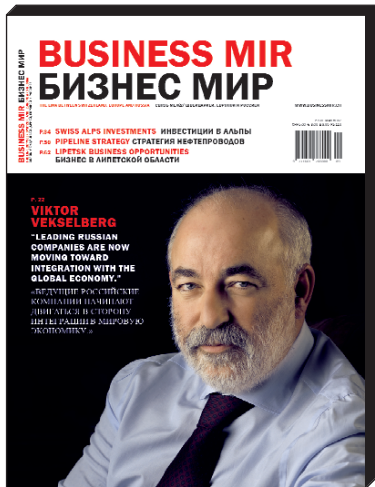
Business Mir n°6 Spring 2007