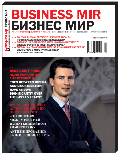
Business Mir n° 15 Winter 09/10